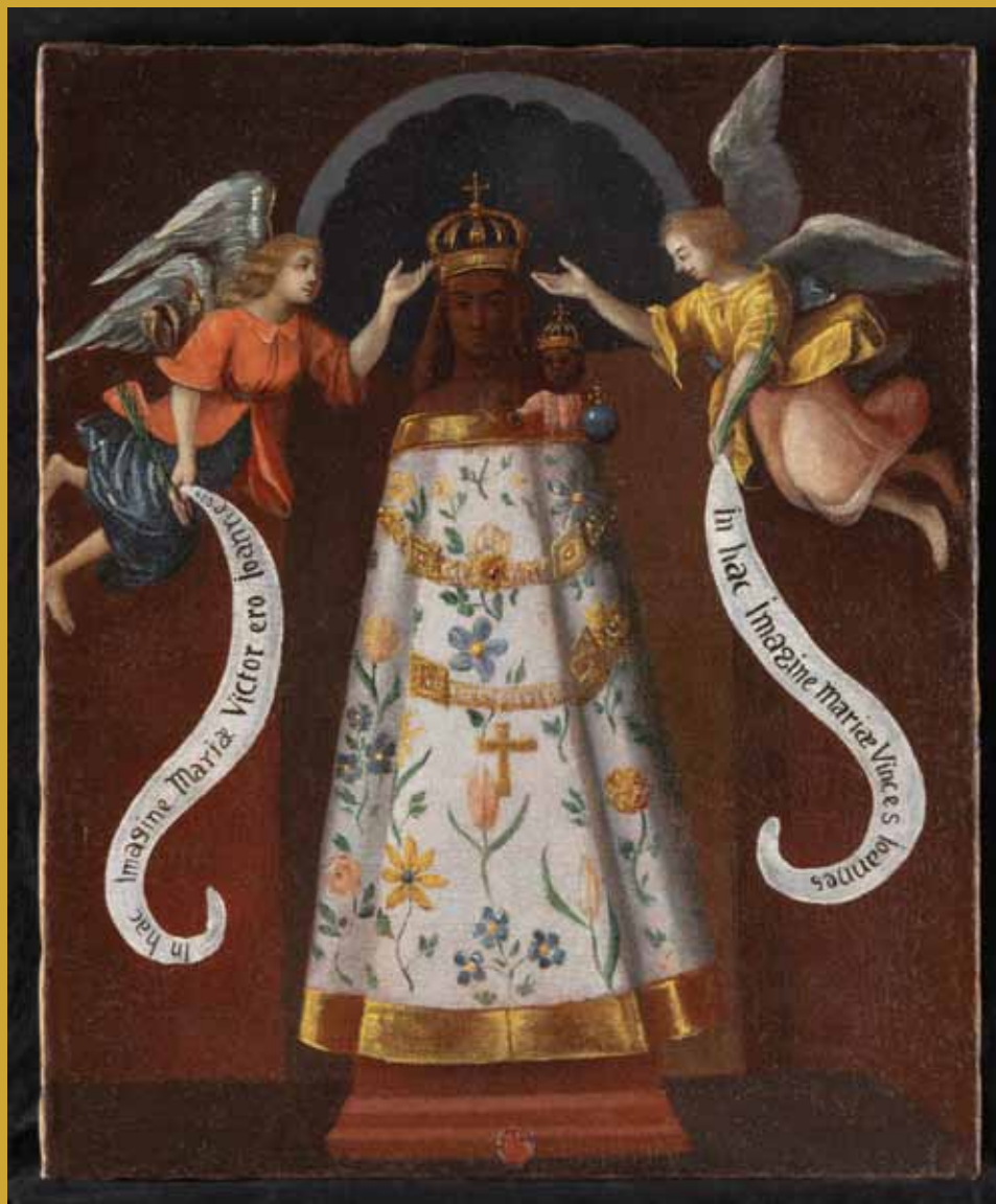
Obraz Matki Bożej Loretańskiej Sobieskich, wł. Rodu Radziwiłłów